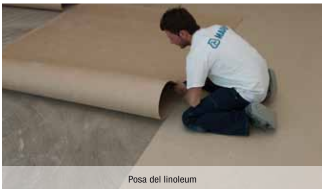
Posa del linoleum