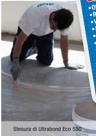
Stesura di Ultrabond Eco 530