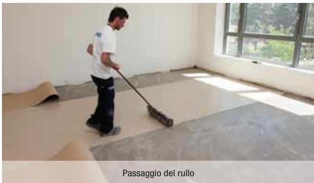
Passaggio del rullo