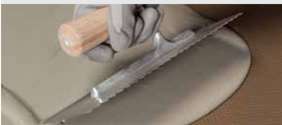
Полагане на втория слой Mapelastic Turbo