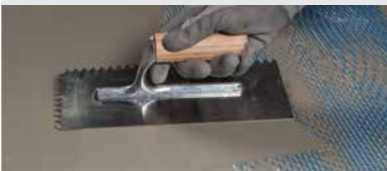
Полагане на Mapenet 150 върху първия слой Mapelastic Turbo