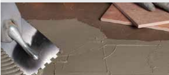
Лепене на плочките с Adesilex P9 Express