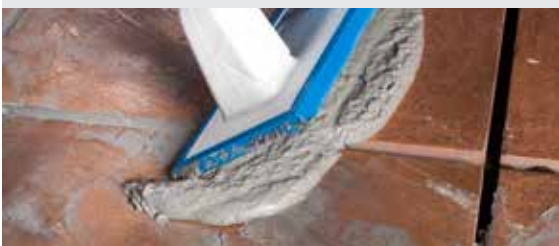
Фугиране на плочките с Ultracolor Plus