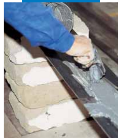
Extendido de Adesilex PG1 sobre una pletina metálica