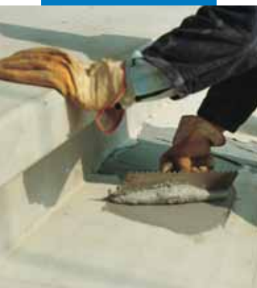
Extendido de Adesilex PG1 con llana dentada para el encolado de peldaños prefabricados