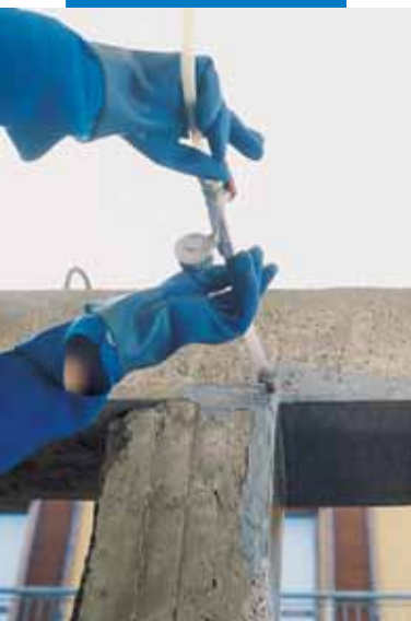
Aplacado metálico con Adesilex PG1