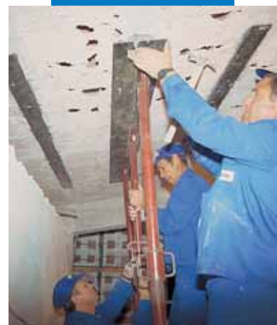
Puesta en obra de una pletina metálica como refuerzo estructural