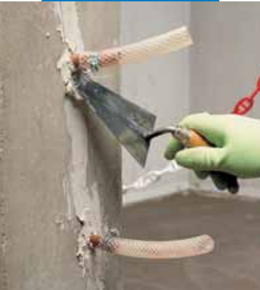
Fijación de la boquilla de inyección y sellado de la fisura antes de proceder a la consolidación estructural