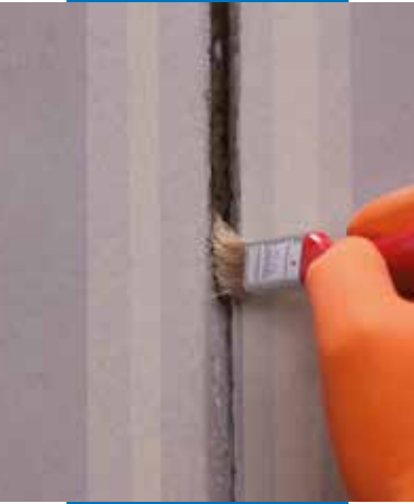
Aplicación de Primer M

Mapeflex PU40 es nocivo y puede provocar, en caso de inhalación, reacciones alérgicas