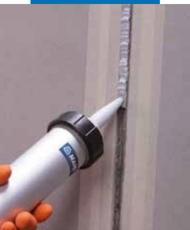
Aplicación de Mapeflex PU40