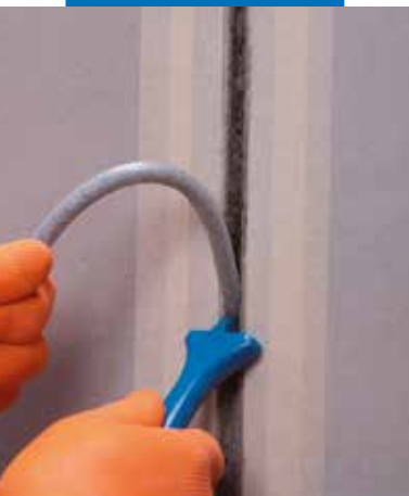
Insertar Mapefoam en el interior de la sede de la junta