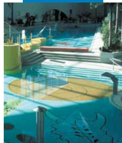
Exemplu de montare de mozaic și klinker la o piscină