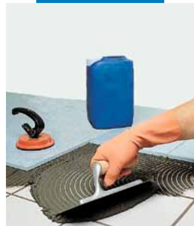
Montare de plăci reconstituite direct pe o pardoseală ceramică, utilizând Granirapid gri