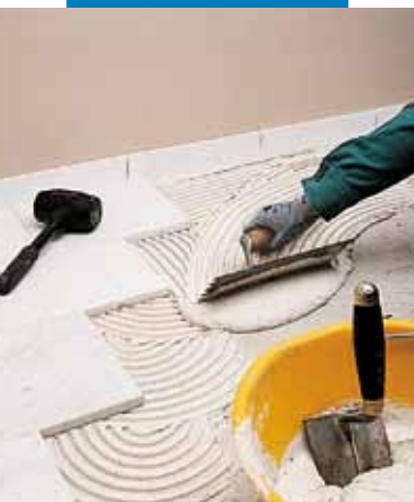
Montare marmură albă Carrara cu Granirapid alb