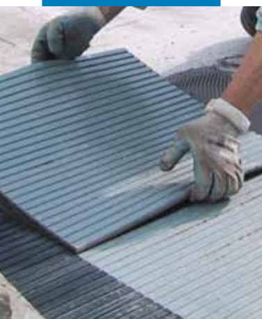
Montare dale de cauciuc cu striății utilizând Granirapid