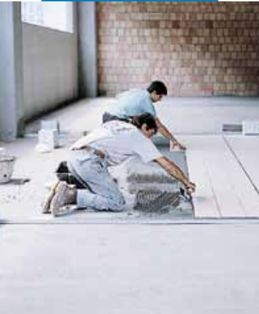
Montare de gresie porțelanată la pardoseală industrială

Suprafața poate fi șlefuită la 24 ore de la lipirea finisajelor (ex. marmura).