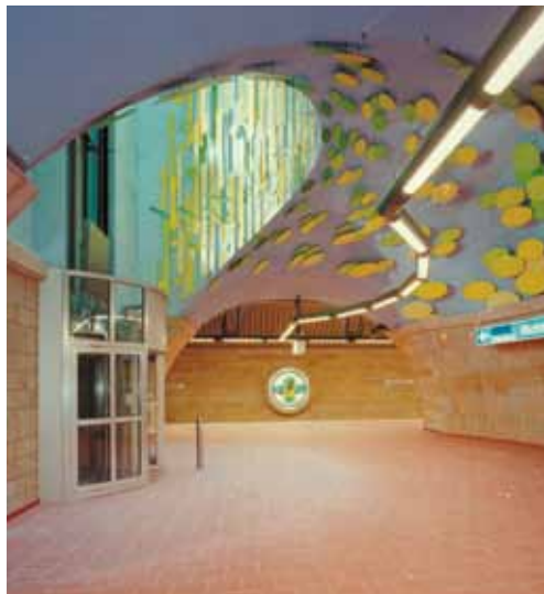
Exemplu de montare de granit folosind Granirapid - Metroul din Mulheim Ruhr (Germania)