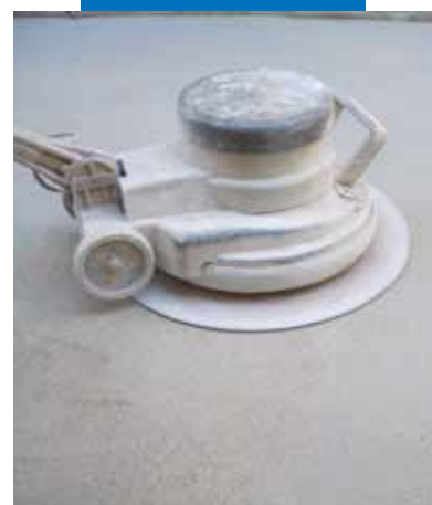
Elicopterizarea - finisarea sapei