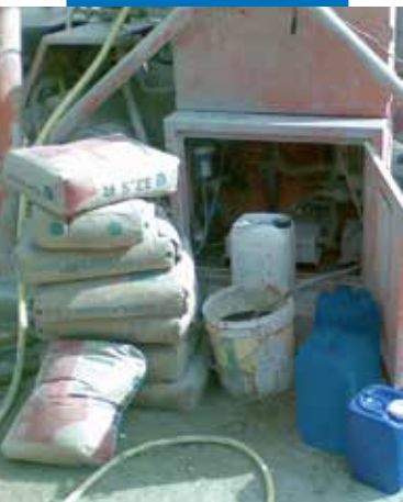
Dozare Mapescreed 704 la prepararea mecanizata a sapeilor