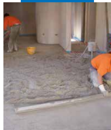
Compactarea amestecului de sapa obtinut cu Mapescreed 704