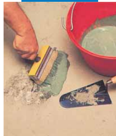
Reparatii localizate la pardoseli: aplicarea amorsei de aderenta