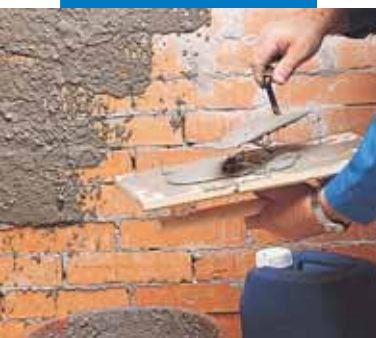
Aplicarea spritului adeziv aditivat cu Planicrete