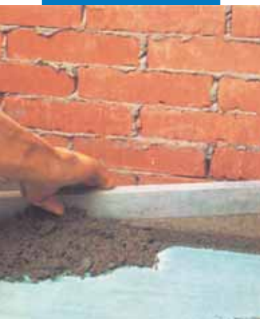
Aplicarea sapei pe baza de ciment aditivată cu Planicrete

fie solide, compacte și curate. De pe suport se vor îndepărta particulele neaderente, praful, laptele de ciment, urmele de uleiuri, decofrol și vopsea, etc., prin sablare cu nisip, periere sau prin sablare cu apă de înaltă presiune. Stratul suport se va uda cu apă până la saturație, după care se așteaptă zăvântarea suprafeței, în caz contrar pelicula de apă se comportă ca antiadeziv.