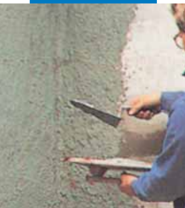
Sprit adeziv aditivat cu Planicrete