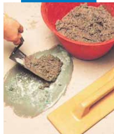
Reparatii localizate la pardoseli: aplicarea mortarului