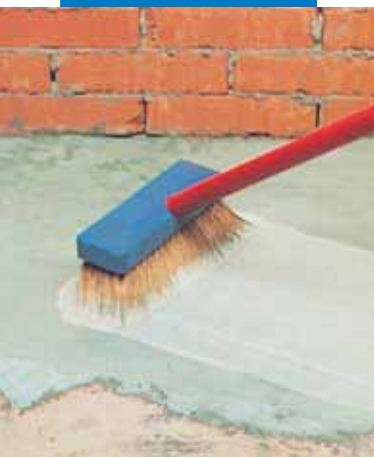
Aplicarea amorsei de aderență pe baza de ciment aditivată cu Planicrete