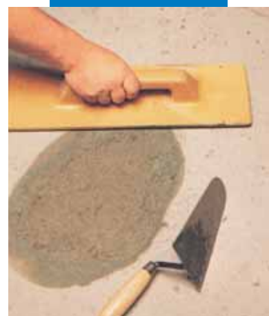
Reparatii localizate la pardoseli: finisarea suprafetei