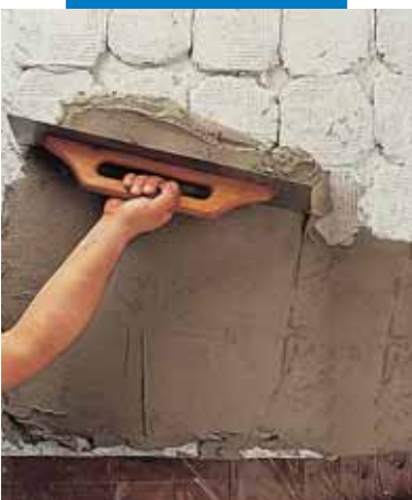
Выравнивание по обшивке