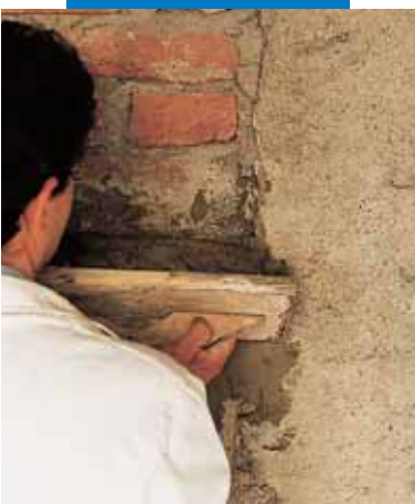
Восстановление старой стеновой кладки