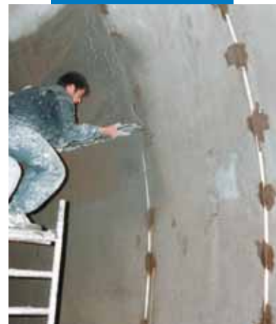
Нанесение штукатурки с маяками