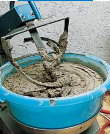
Перемешивание в минибетономешалке