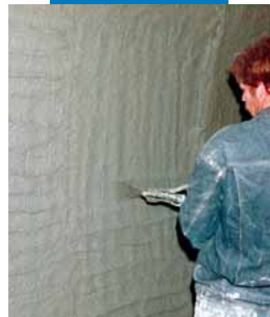
Нанесение Nivoplan набрызгом

Список значимых объектов использования данного материала доступен по требованию