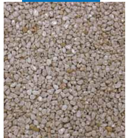
"Terrazzo alla veneziana"-finish. Applicering av Mapefloor I 910 + naturlig tillslag blandningen