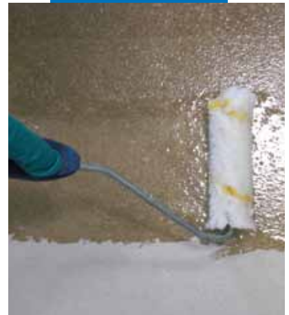
"Terrazzo alla veneziana"-finish. Applicering av Mapefloor I 910