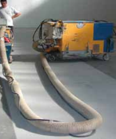
Förberedning av underlaget genom stålsandsblästring