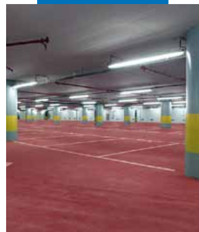
Golv tillverkade med röd Ultratop i Berlaymont-byggnaden i Bryssel