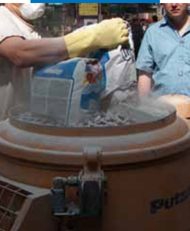
Förberedning av Ultratop i blandare

Ultratop kan även användas för att tillverka golv av typen "Terrazzo alla Veneziana" där olika typer av tillslag (olika färg, form och storlek) tillsätts och slipas till ett exklusivt och autentiskt utseende på ett enkelt och snabbt vis.