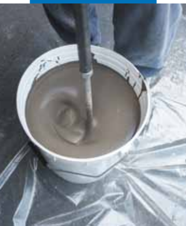
Förberedning av produkten med borrvisp