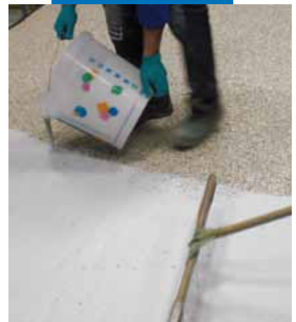
Applicering av Ultratop på det härdade underlaget av naturligt tillslag och Mapefloor I 910