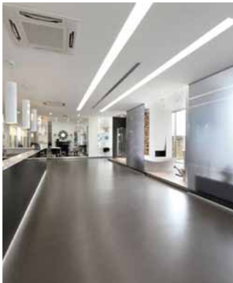
Show-room Quartarella Altamura (Bari) - Italien Ultratop antracit "naturlig finish"