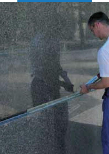
Tesnenie škár na fasáde