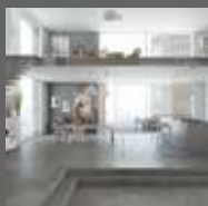
Жилые помещения Residential settings