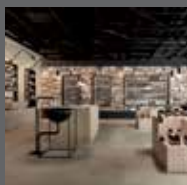
Коммерческие помещения Commercial areas