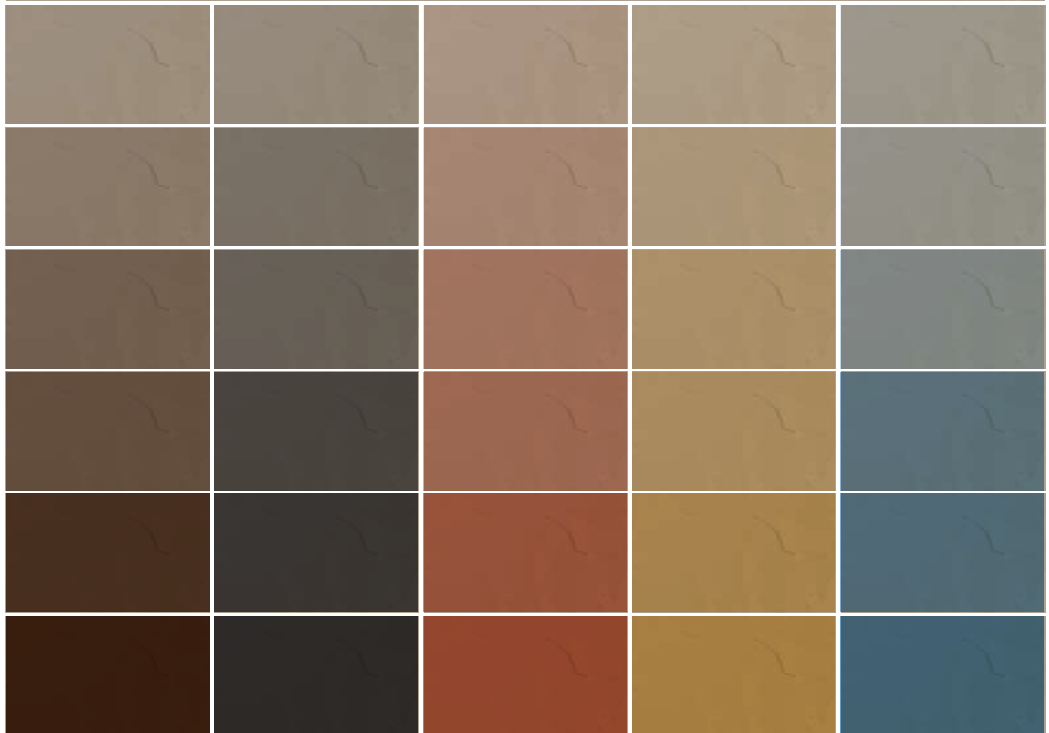
Ultratop Color Paste Коричневый Brown