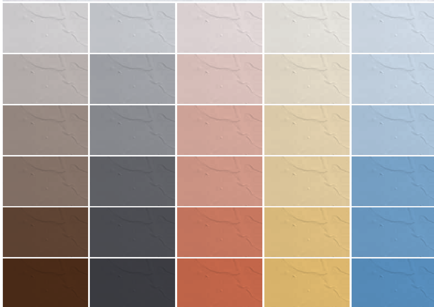
Ultratop Color Paste Коричневый Brown