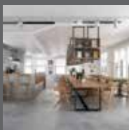
Рестораны и вестибюли отелей Restaurants and Hotel lobbies