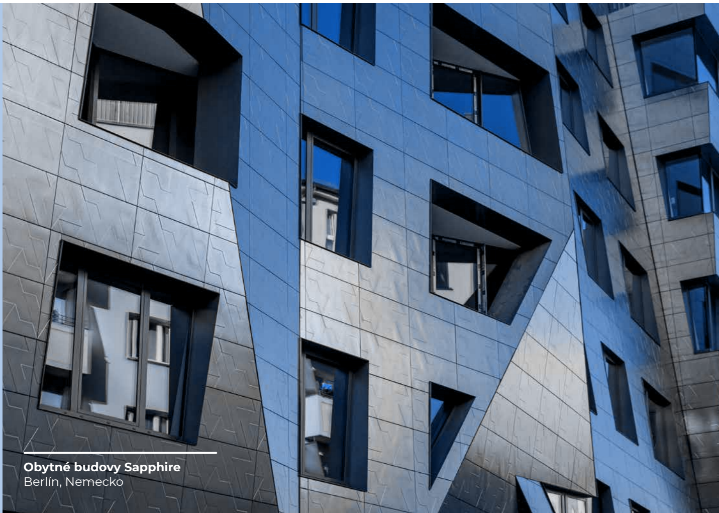
Obytné budovy Sapphire Berlín, Nemecko

V danej situácii je dovolené poskytovať vhodné dary, príspevky, sponzorstvo alebo organizovať zábavu. Výmena darov skromnej hodnoty bežne akceptovanej na medzinárodnej úrovni môže posilniť a rozvíjať obchodné