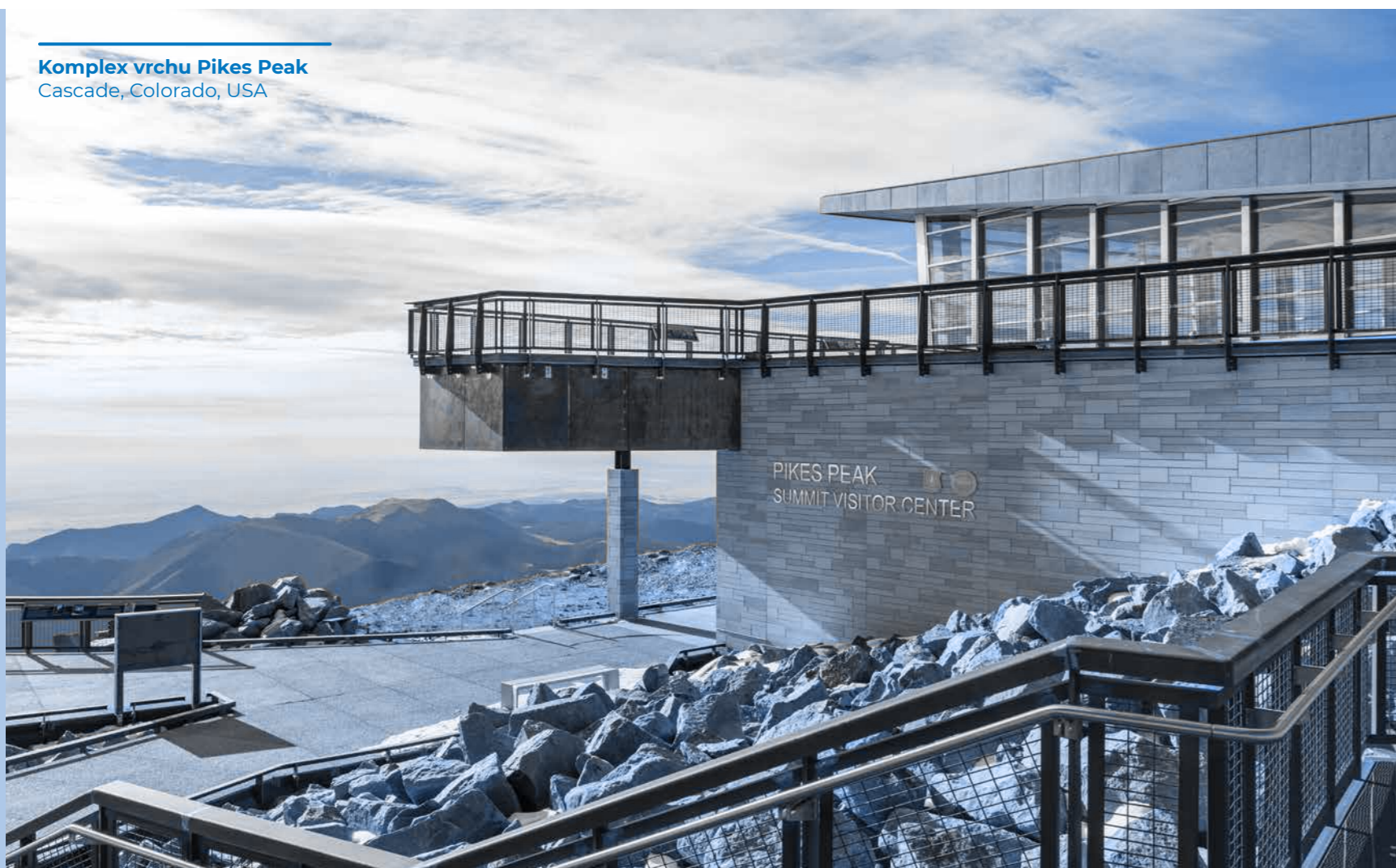
Komplex vrchu Pikes Peak Cascade, Colorado, USA