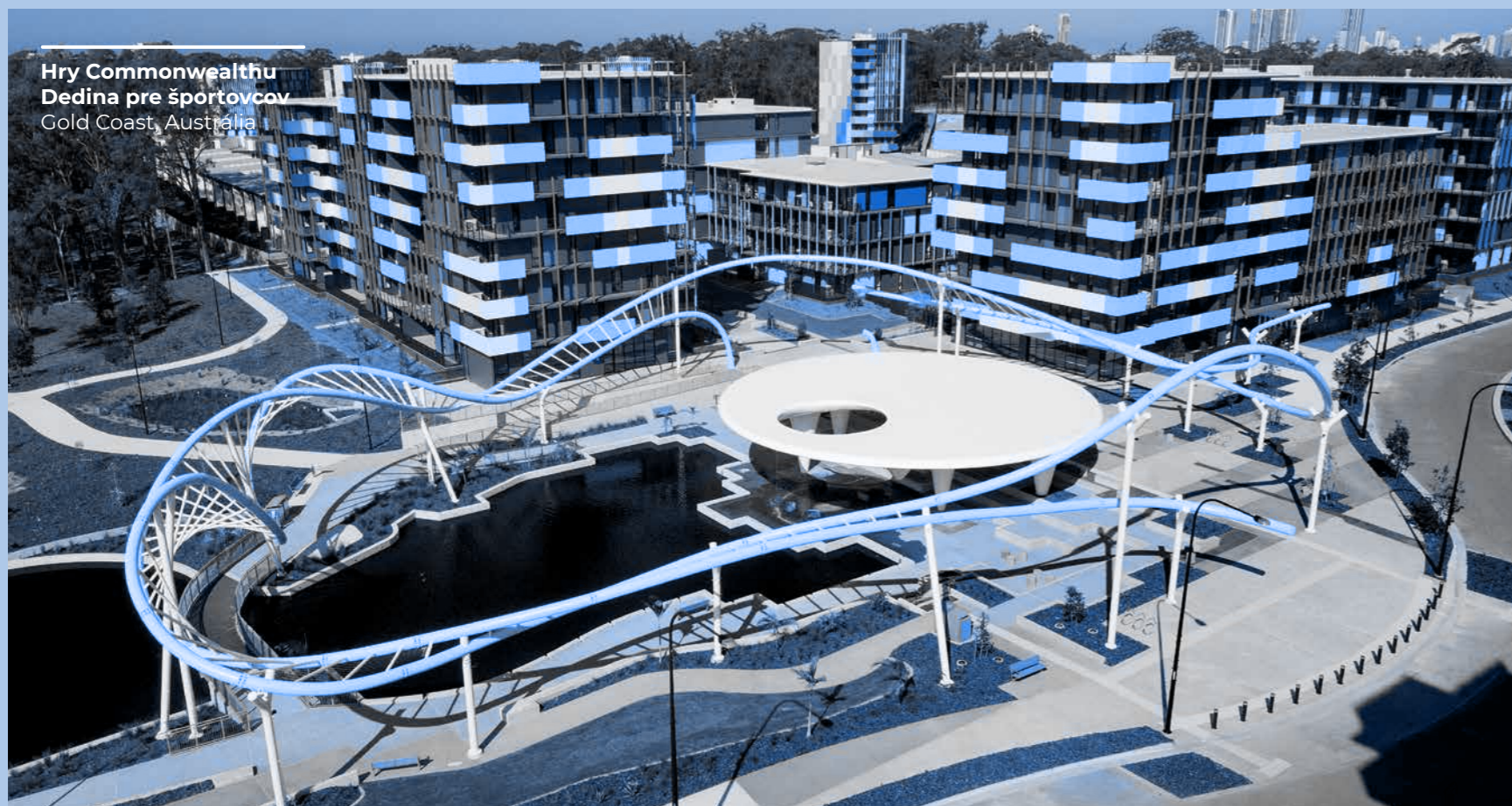
Hry Commonwealthu Dedina pre športovcov Gold Coast, Austrália

Skupina Mapei sa snaží zaručiť pracovné podmienky rešpektujúce ľudské práva a úplne sa vyhýba akejkoľvek forme nezákonnej, detskej, nútenej alebo nátlakovej práce, obchodovania s ľuďmi alebo akýchkoľvek postupov, ktoré sa považujú za moderné formy otroctva.