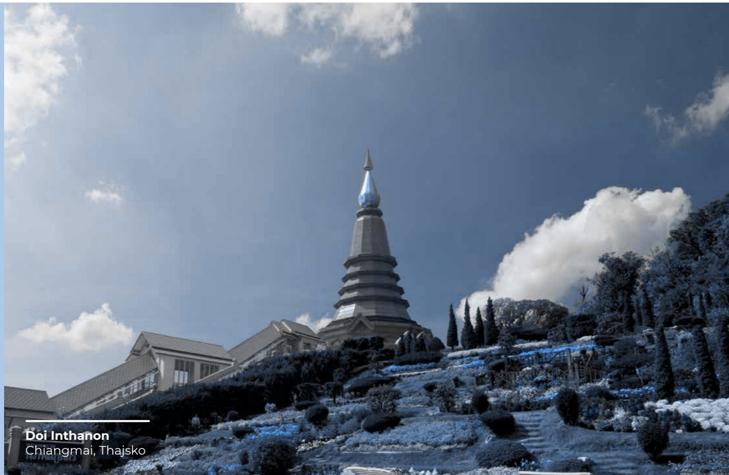
Doi Inthanon Chiangmai, Thajsko

Cieľom Skupiny je prispievať k rastu komunit, v ktorých pôsobí, a to najmä maximálnou možnou podporou