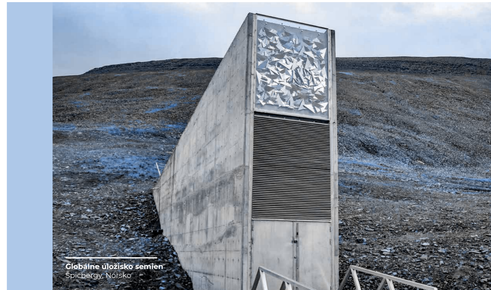
Globálne úložisko semien Špicbergy, Nórsko