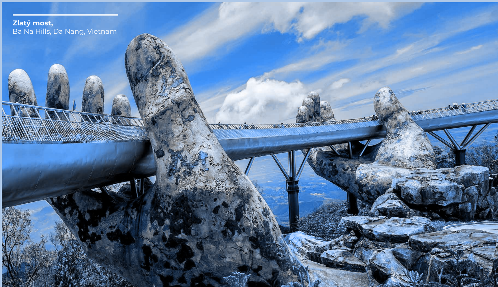
Zlatý most, Ba Na Hills, Da Nang, Vietnam

Všetci riaditelia, konatelia a zamestnanci spoločností skupiny Mapei (ďalej len „ľudia skupiny Mapei“ alebo „zamestnanci“) a ďalšie subjekty a spoločnosti konajúce v mene skupiny Mapei (ďalej len „adresáti Kódexu“ vrátane „ľudí skupiny Mapei“) musia vykonávať svoje činnosti, úlohy a zodpovednosti v súlade so zásadami, hodnotami a pravidlami definovanými v tomto Kódexe. Dodržiavanie Etického kódexu sa považuje za základnú požiadavku zmluvných záväzkov všetkých ľudí skupiny Mapei.