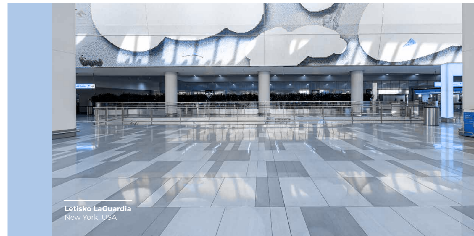
Letisko LaGuardia New York, USA

Ak je odpoveď aj len na jednu z týchto otázok „nie“ alebo ak máme pochybnosti o legitímnosti nášho konania alebo uplatňovaní zásad Kódexu, musíme prestať a požiadať