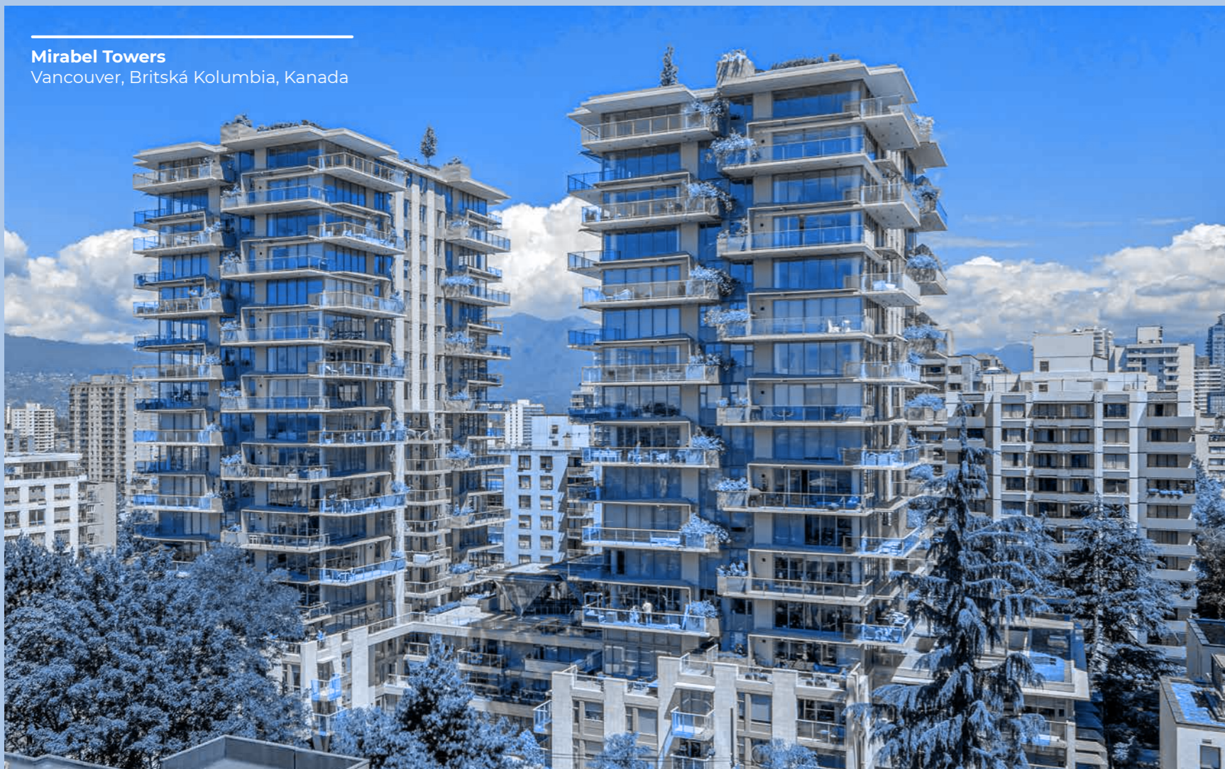
Mirabel Towers Vancouver, Britská Kolumbia, Kanada

Zaznamenajte a nahláste svojmu priamemu nadriadenému a internému auditu spoločnosti všetky podozrivé podvodné situácie a všetky prípady podvodu, ktoré sa vyskytli.