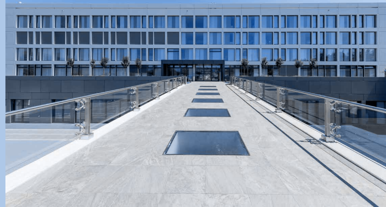
Nemocnica De La Tour Meyrin, Švajčiarsko

e-mailovej adrese codeofethics@mapei.com (spravovanej výlučne oddelením vnútorného auditu podniku a oddelením ľudských zdrojov podniku a organizácie) alebo prostredníctvom online portálu Whistleblowing.