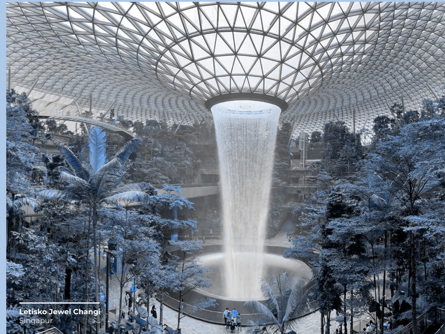
Letisko Jewel Changi Singapur

Údaje akéhokoľvek zamestnanca alebo inej osoby, ktoré je