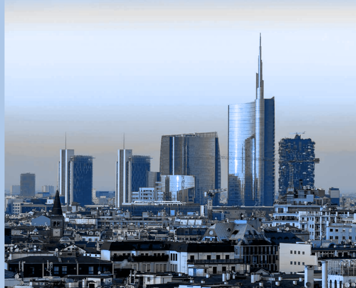
Porta Nuova Miláno, Taliansko

Preto sa všetci adresáti tohto Kódexu musia vyhýbať akékoľvek situácii, v ktorej môže vzniknúť konflikt záujmov alebo môže zasahovať, hoci len zdanlivo, do ich schopnosti prijímať rozhodnutia vo výlučnom záujme Skupiny.