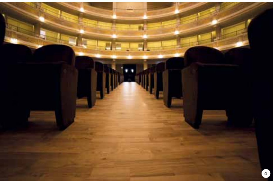
FOTO 4. Il parquet in rovere nella platea e nei tre ordini è stato posato con ULTRABOND ECO S955 1K, adatto per pavimenti radianti.

FOTO 5. Il rivestimento in tessuto nei palchi è stato incollato con ADESILEX MT 32.